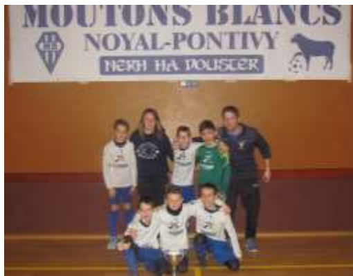
2 ème du tournoi U11: les Moutons Blancs !