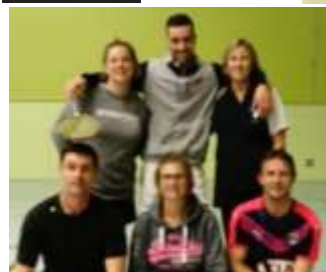
BCN D3 - Bad Pays Ploërmel